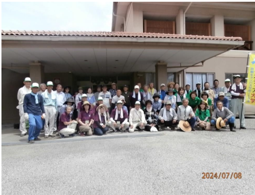
令和6年7月8日レイカディア大学彦根キャンパスサポートの会 交流行事